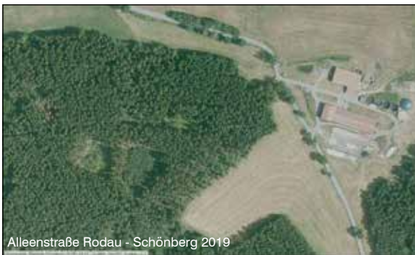
Alleestraße Rodau - Schönberg 2019