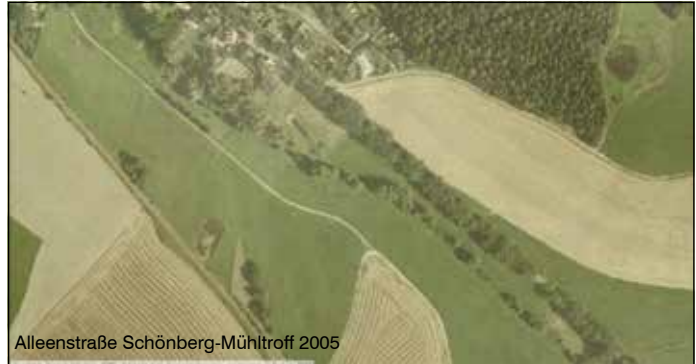
Alleestraße Schönberg-Mühltroff 2005