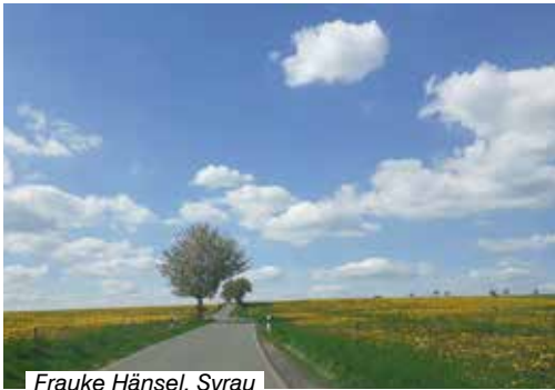
Frauke Hänsel, Syrau