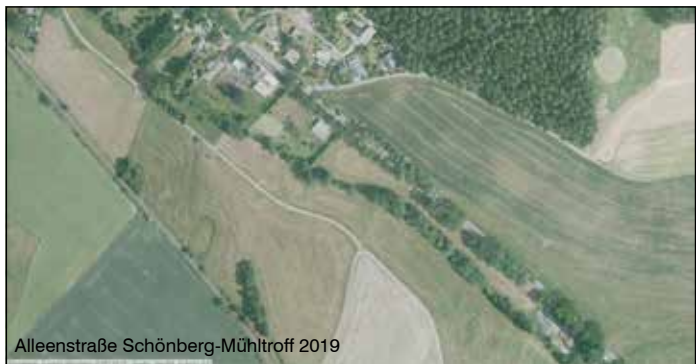
Alleestraße Schönberg-Mühltroff 2019

Die Initiative Neue Alleen für Weischlitz, Rosenbach und Pausa-Mühltroff bestehend aus den Vereinen ProVogtlandschaft e.V., FFV Rosenbach e.V., BUND e.V., Regionalgruppe Vogtland und der BI zum Schutz von Natur und Umwelt von Gold- bis Rosenbach e.V.