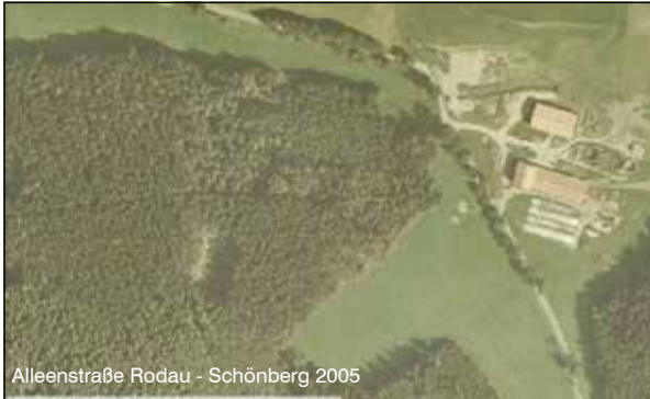
Alleestraße Rodau - Schönberg 2005

Wie grüne Adern ziehen Sie sich durch unsere vogtländische Landschaft, verbinden Wälder, Dörfer und Felder. Wer kennt sie nicht die ansehnlichen Eichenalleen zwischen Reuth-Mißlareuth, Schönberg-Mühltroff oder Leubnitz und Fasendorf. Jedoch sind die Bestände in unseren Gemeinden stark überaltert, krank und in einem schlechten Pflegezustand. In den kommenden 15 Jahren werden daher nach ersten Schätzungen ca. \frac{2}{3} unserer Alleen absterben und gefällt. Ein altes Kulturgut geht somit für immer verloren, da Neu- und Nachpflanzungen aufgrund der angespannten Finanzlage in unserer Gemeinden meist völlig aus bleiben.